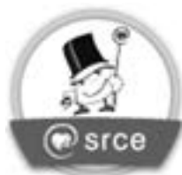
Slika 7.3. Primjer digitalne značke koju izdaje Centar za e-učenje Sveučilišnoga računskog centra nakon zadovoljavanja uvjeta za završetak tečaja

canje. U kontekstu otvorenog obrazovanja digitalne značke ( https://openbadges.org/ ) velik su potencijal da kvalitetni otvoreni obrazovni sadržaji budu prepoznati i da ih prihvate obrazovne ustanove, stručna društva ili tvrtke kao priznavanje znanja i vještina stečenih s pomoću otvorenih obrazovnih sadržaja.