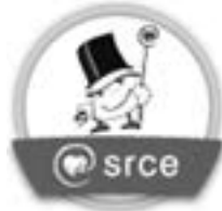
Slika 7.3. Primjer digitalne značke koju izdaje Centar za e-učenje Sveučilišnoga računskog centra nakon zadovoljavanja uvjeta za završetak tečaja

canje. U kontekstu otvorenog obrazovanja digitalne značke ( https://openbadges.org/ ) velik su potencijal da kvalitetni otvoreni obrazovni sadržaji budu prepoznati i da ih prihvate obrazovne ustanove, stručna društva ili tvrtke kao priznavanje znanja i vještina stečenih s pomoću otvorenih obrazovnih sadržaja.